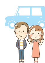
別居の扶養親族 (息子・娘)